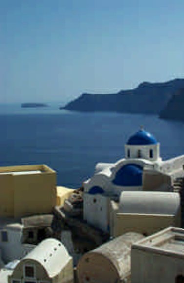
➤ Santorini Adası, Oia Kasabası'nın evleri

Dar ve ağaçlıklı yolun bir tarafı 8 km uzunluğunda kap-kara kumsal, diğer tarafında da barlar, kafeler, kulüpler çardakların altına yerleşmiş durumdadır. Yunanistan'daki bir diğer güzel uygulama da; plajların hiçbirinde bir kısıtlama olmaması. İstedığınız her plaja ücretsiz girebilirsiniz. Sadece yatmak için sez-long ve şemsiye istediğinizde 2 kişi için ortalama 5 euro ödemek durumundasınız. Perissa'nın hemen yanında adalar üzerindeki en değerli arkeolojik alanlardan biri olan Akrotiri Kasabası var. Burası adanın çöküşüne neden olan volkan püskürmesinde Pompei'ye benzer biçimde lav altında kalmış antik bir Minos yerleşimi. 1967'de 3500 yılın ardından tonlarca külün altından gün ışığına çıkartılan Akrotiri'nin en önemli buluntuları ise renklerini dahi kaybetmeyen freskleri. Fresklerin bazıları Atina Ulusal Arkeoloji Müzesi'nde, bazıları ise Fira'nın merkezinde kurulmuş, küçük, modern Arkeoloji Müzesi'nde saklanmakta, özellikle "Balıkçı Çocuk" ve "Boks Yapan Gençler" freskleri görülmeye değer niteliktedir. Günümüzü Perissa'da geçirip, akşam üzeri Fira'ya uğradıktan sonra motor için enfes sayılabilecek dolambaçlı bir yoldan en kuzeye, Oia'ya,