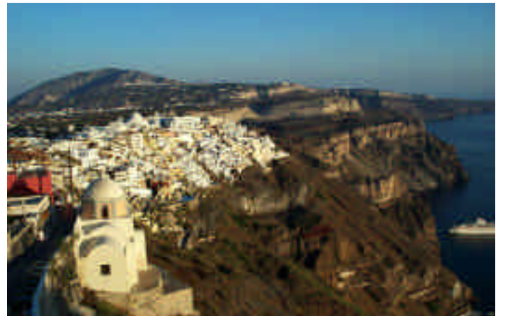
➤ Santorini, tarife gerek var mı?

Fira'yı görmek için yaşadığımız bir terastan olağanüstü bir manzara seriliyor gözlerimizin önüne. Sol yanımızda Fira şehri, önümüzde kartpostalda fırlamış gibi duran mavi kubbeli bir kilise ve güneş batıyor. Bütün ada misafirlerinin katıldığı bir akşamüstü ritüeli bu, herkes şehrin denize yüzlerce metre yukarıdan bakan sokaklarına dizilmiş, bu ana tanıklık ediyor, üstelik adeta hergün tekrarlanan bir tören haline dönüşmüş. Güneş batmaz bizim aklımıza hala bir yerimizin olmadığı geliyor, atlıyoruz motora çevreyi dolaşarak otel arıyoruz. Denize bakan, birbirinin üzerine asılmış gibi duran binalar arasındaki otellerde fiyatlar gecesi odabaşı 300-400 Euro arasında değiştiği için doğruca deniz görmeyen otellere yöneliyoruz. Fira'nın kuzeyine doğru sürüyorum motoru, biraz sonra içgüdüsel olarak sola sapıyorum. Bir otel var, Ceyda inip fiyat almaya gidiyor, ben de dönmek için az ileri devam ediyorum. Rastladığım "Pansiyon Santor Inn, kiralık odalar" tabelasını görüp içeri girdiğimde duvarda asılı fotoğraflardan eski bir subay olduğu anlaşılan yaşlı bir adam karşılıyor beni. Mükemmel ingilizce konuşuyor, oda var, gecesi 60 Euro. Kahvaltı elbetteki bir Yunan Adası klasiği olarak mevcut değil. Ceyda'yı çağırıyorum, oda çok güzel, gayet büyük ve banyolu. Eşyaları koyup birkaç adım yürüdüğümüzde şehre bakan bir terasa ulaşıyoruz ve neredeyse bütün şehir halkı burada; odadan manzara görmüyoruz ama şehrin en güzel gö-