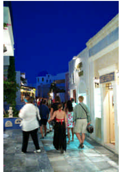
➤ Oia'da gece

Santorini'deki son günümüzde, denizin ortasında yer alan ve hala aktif olan kraterin olduğu adacığı gezmek istiyoruz. Fira'nın meydanında bir köşede, buraya düzenlenen turları satan Pelican isimli acentadan bilet aldıktan sonra, genelde katırlarla inilen Fira'nın Skala Fira isimli eski, küçük limanına yürüyerek inmeye çalışıyoruz. 580 basamağı inerken, biz bitiyoruz basamaklar bitmiyor. Zar zor tekneye yetişip 10 dakikada hemen önümüzdeki krateri ulaştık. Yunan aksanıyla İngilizce konuşan rehberimiz, öğle sıcağında koşturarak krater tepesine çıkarıyor bizi. Santorini'nin bütün yapılarını-