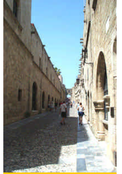
➤ Rodos, Şövalyeler Sokağı

bir Suzuki ile önce Rodos'un güneyinde gelenekselliğini en iyi korumuş olan Lindos Kasabası'na gitmek için yola çıkıyoruz. Benzinci ararken rastladığımız Michelin Bayisi dikkatimi çekiyor. İstanbul'daki scooterimin lastikleri yirmibin kilometreyi geçtiği için değiştirmek istediğim ancak bulamadığım Bopper'ların olup olmadığını soruyorum heyecanla. Lastik var ve tanesi 32 Euro civarında. Tarihini kontrol ediyorum, 2002 ortası neredeyse, kredi kartıyla iki tane alıp bagaja koyuyorum.