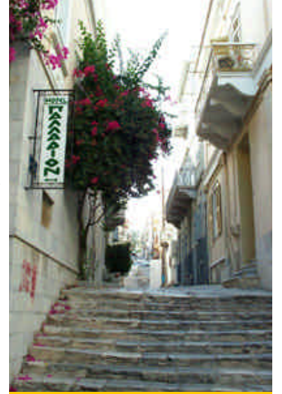
➤ Siros Adası, Ermoupolis'in mermer kaplı sokakları