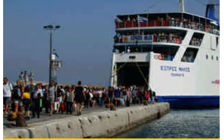
➤ Ada limanları'ndan bir kesit, Express Milos kalkışa hazırlanıyor

yı 13. yüzyılda fetheden Venedikliler ise Azize İrene'ye atfen Santorini olarak adlandırmışlar. Athinios, Santorini'nin yeni limanı. İner inmez sizi otobüsler bekliyor ve 1 Euro karşılığında istediğiniz şehre gitmeniz mümkün. Döne dolaşa yüzlerce metre yukarı çıkan otobüs ile Santorini'nin merkezi olan Fira Şehri'ne gidiyoruz. Theotokopoulou Meydanı'na iner inmez gözümde bir motor kiralama dükkanı kestiriyorum, günlerdir 50cc'liğe bindiğimizden dolayı ikimiz de bıkkın durumdayız, o yüzden 80'lik iri cüsseli bir Peugeot Elyseo kiralyoruz, 2 günlüğü 45 Euro. Selesi limuzin gibi, sele altına çantaları tikiştiriyor, kaskları takıp otel aramaya çıkıyoruz. Fira Şehri'nin içine çok dar ve merdivenli sokaklar yüzünden araç giremiyor ancak şehrin arkasında devam eden yol boyunca motorla devam edip, istediğiniz bir ara sokaktan şehre katılmanız mümkün. Katıldığınız ara sokak başları zaten motor parkı halini almış.