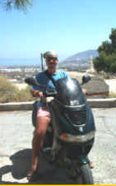
➤ Santorini, 80cc'lik canavar motorumuz

da kullanılan siyah volkanik taşlardan oluşan, Nea Kameni isimli bitkisiz bu garip adacığın yerinden yükselen ısı ayakkabılarımızın tabanını gevşetiyor. Sonunda tepeye vardığımızda hala sülfür kokan aktif krater önümüzde. Az ileride gözükten Fira ve Oia'nın silüeti ise harika. Tekne bizi toplayıp hemen arkadaki daha küçük Palaia Kameni Adası'nın kıyasına götürüyor. Burada bir sıcak su kaynağı denize karışıyor, su ısısı yaklaşık 38 derece. Turdan dönüşte, limandan Fira'ya yaklaşık 2 dakikada çıkan ve kişi başına 3 Euro ödenen teleferiği kullanıyoruz.