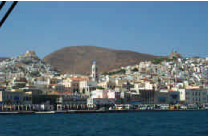
➤ Ermoupolis, gidilip görülmesi gerekli güzel bir şehir