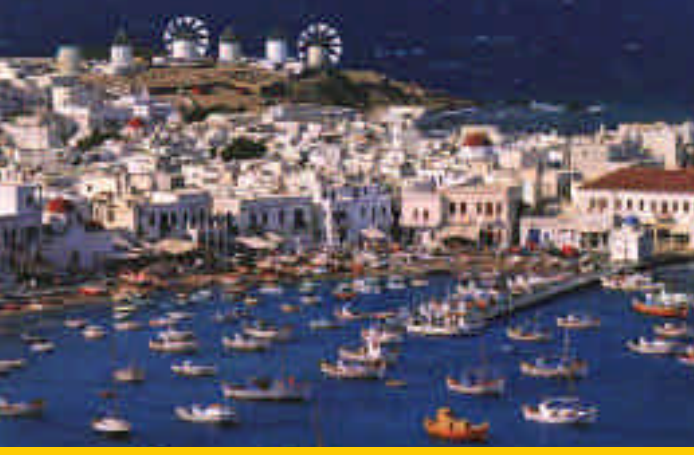
➤ Mikonos, Hora Kasabası

barlar ve restoranlar kalabalık ancak bizim Bodrum'da olduğu gibi kulakları yırtan bir müzik yok. Rastladığımız birkaç otelde de yer yok. Tam o sırada önünde durduğumuz bir hediyelik eşya dükkanı sahibi yer arayıp aramadığımızı soruyor, 70 Euro'ya kendisinin bir odası olduğunu söylüyor. Kabul etmemiz üzerine dükkanını kapatmak için biraz süre istiyor, gecenin satışını yapmış olmaktan son derece mutlu, o önde, biz arkada gecenin içinde ilerliyoruz. "Herhalde bize evinde bir oda verecek" diye gayet sesli bir Türkçe ile düşünürken 5 dakika sonra hayatımızda gördüğümüz en dar sokaklardan birine giriyoruz. Adada yaşayan halkın çoğunluğu bu kadın gibi küçük evlerinin alt katını bir odaya dönüştürmüş. Sokaktan direkt girilen, içinde mutfaklığı, banyosu olan gayet temiz bembeyaz bir oda burası. Hafif hafif esen meltem rüzgarı sayesinde nere-