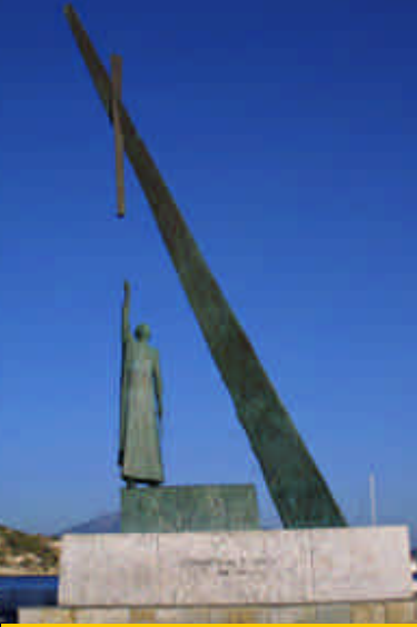
➤ Samos Adası, Pisagor Heykeli, hemen arkasında Davutlar Milli Parkı