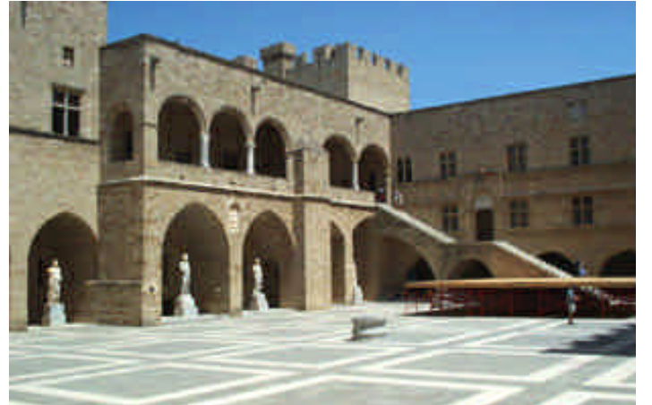
➤ Rodos, Üstadlar Sarayı'nın Avlusu

Kale içindeki Büyük Üstadlar Sarayı ve Şövalyeler Sokağı Rodos'un görülmesi gereken yerlerinden. Kale çevresi'ndeki kent 19. yüzyılda büyümüş ve 1920'lerden itibaren İtalyanların eline geçmiş. Liman çevresinde görkemli devlet binaları inşa ettiren İtalyanlar'ın etkileri kentin doğu kısmındaki Nea Agora ve Mandraki Limanları'ndan başka çevredeki dükkânlarda da hala kendisini göstermektedir. Kale içindeki pek çok yapı özellikle Saray ve Şövalyeler Sokağı Mussolini'nin ziyareti şerefine adeta yeniden yapılmış denecek biçimde elden geçmiş. Sarayın içindeki mozaiklerin çoğu Kos'tan getirilmiş ve son derece iyi korunmuş. Çok iyi düzenlenmiş modern bir müze de sarayın bodrumlarında son derece iyi klimatize edilmiş odalardan oluşuyor. Kale içinde gezerken Osmanlı'dan kalan camileri, hanları da görmek mümkün. Kentte gezerken, her yerde olduğu gibi motorsiklet fazlalığı yine dikkatimizi çekiyor.