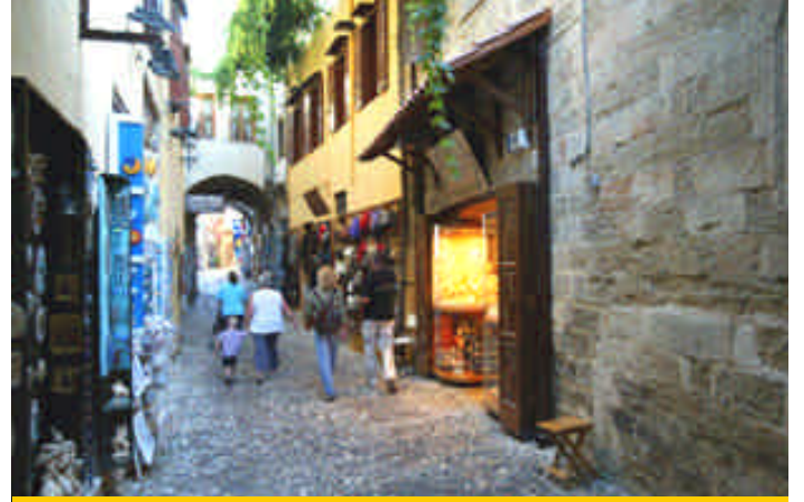
➤ Rodos kaleiçi

bir binadan gecesi 35 Euro'ya oda veriyor bize. Bina yeni ve içinde bir tek üçümüz varız, anahtar da bizde olduğu için adeta Kos'ta ev almış gibiyiz. Eşyaları bırakarak sahildeki kalenin biraz ilerisindeki plaja yürüyoruz. Karşıda Akyarlar, Karaincir ve Turgut Reis gözüküyor.