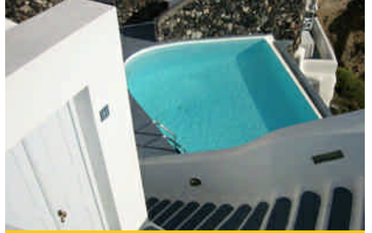
➤ Santorini Adası, Fira Kasabası'nın lüks otelleri