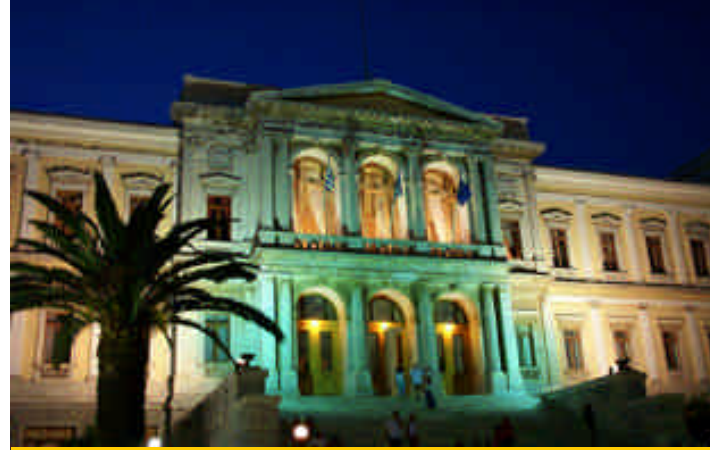
➤ Siros Adası, Ermoupolis Belediye Binası

Mikonos'ta herhangi bir yer ayarlaması yapmamış ve gece ulaşabilecekseniz, yer bulma konusunda size ancak şansınız yardım edebilir. Geçen yıl sadece bu adaya bir milyon turist geldiği ve bu turistlerin her birinin en az 7 gece konakladığı göz önüne alındığında yer bulamamak son derece doğal. Saatler geceyarısını gösterirken indiğimiz Mikonos'un merkezi olan Hora Kasabası'nın limanı panayır yeri gibi. Geminin önünde tuzak kurmuş olan oda satıcılarına fiyat soruyorum, 100 Euro'dan kapı açıyorlar, onlar da şehir dışında... Bütün acentalar kapanmış ya da kapanmak üzere, şehrin iç kısımlarında daha rahat yer bulabileceğimizi düşünerek bir