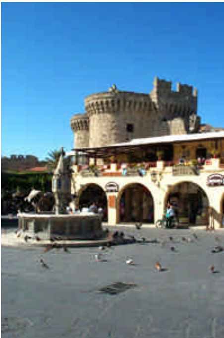
➤ Rodos kaleiçi