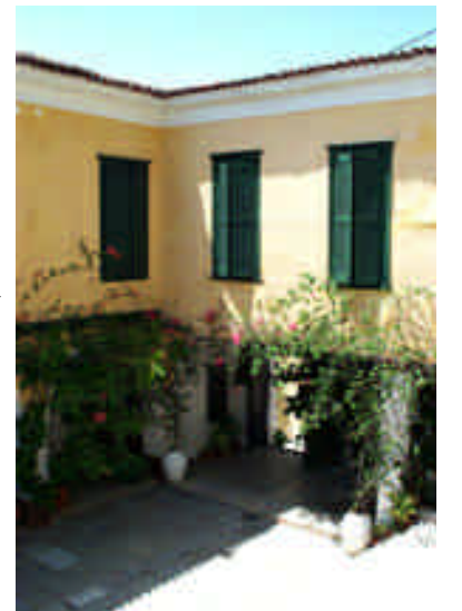
➤ Samos Adası, Vathi Kasabası, Avli Pansiyon