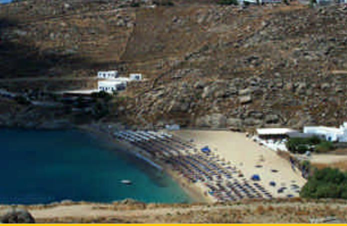
➤ Mikonos Adası'nın ünlü Super Paradise Plajı

karşısından 20 Euro'ya bir scooter kiralyoruz, bu defa 50'lik bir sarı Typhoon 50. Korumalar, kasklar giyildikten sonra sabah 9.30'da 6 km uzaktaki Paradise Camping plajındayız. Paradise Camping'ler bazı adalarda bulunan tam teşekküllü konaklama-yüzme-yeme-içme mekanları. Paradise Beach güzel bir plaj. Bu plajdaki işletmede 2 adet bar, 2 adet restoran, alışveriş için bir yer, duşlar, tuvaletler, havuz, bungalowlar ve çadır alanlarından oluşmuş alternatif bir yaşam alanı yaratılmış.