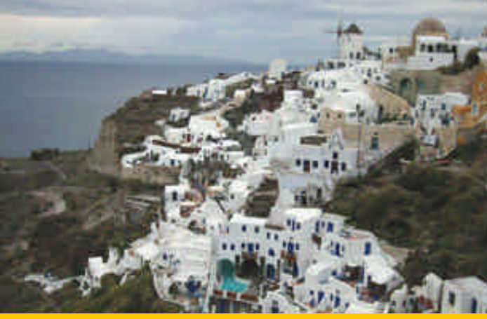
➤ Santorini Adası, Oia Kasabası

rüntüğü noktadan sadece 20 metre uzaktayız. Akşam yemeği için dolanıyoruz. Şehirde ya bara benzeyen kafeler, ya da ayaküstü gyro (döner) yapan yerler bulabildiğimiz için hiçbirini beğenemedik. Çok büyük açtığı kreplere enfes malzemeler koyan bir krepçide yediğimiz yemek sonrası Santor Inn'e döndük.