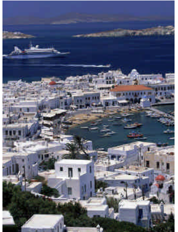
➤ Mikonos, Hora Kasabası, ileride Delos Adası

Saat geceyarısını bulduğunda indiğimiz Hora Meydanı cıvı cıvı,