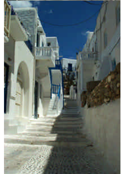
➤ Mikonos Adası, Hora Kasabası'nın sürekli boyanan beyaz sokakları

Sabah 09:00 için Santorini'ye biletimiz var ama burada da denize girebilmek için öğleden sonra saat 14:30'daki ile değiştiriyoruz, iki ada arasını üç buçuk saatte alan "Flying Cat" isimli katamaranın fiyatı kişi başı 22 Euro. Santorini'den de Rodos'a geçeceğiz. Ancak haritaya bakarsanız bu iş gemi ile deveye hendek atlatmaktan zor çünkü Santorini Kiklad Grubu'nun en güneyde yer alan adası ve ikisi arasında direkt sefer yok. Aktarmalı olarak yaklaşık 6-7 adaya uğrayarak 1 günde gidebiliyorsunuz. Aklıma uçakla gitmek gibi parlak bir fikir geliyor, soruyoruz, evet uçak var ve fiyatı 75 Euro. Biletleri alıyoruz, ve hemen limanın