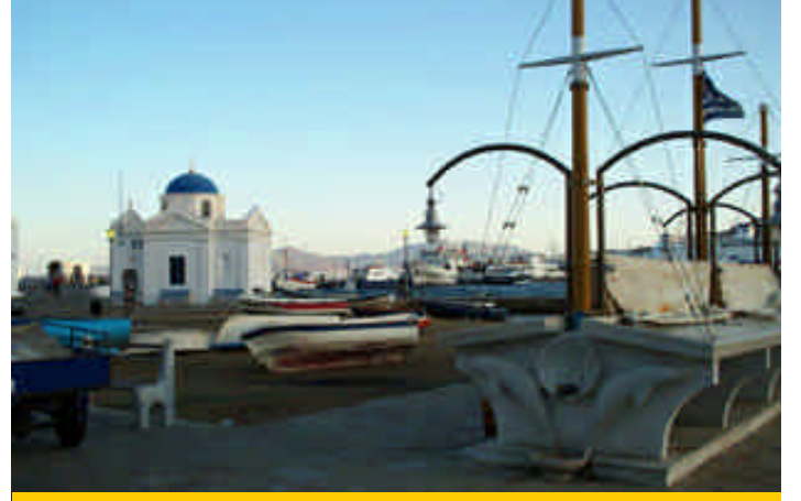
➤ Mikonos Adası, Hora Kasabası'nın Limanı'ndaki Balıkçı Tezgahı

İnsanların yavaş yavaş yatmaya gittiği saatler olan 06:30'da, hafifçe serin, güneşli bir Mikonos sabahına açıyoruz gözümüzü. Kendimizi hemen sokağa atıyoruz, gece kıyafetli insanlar geçiyor önümüzden. Rehber kitap, gezenlerin muhakkak kayb olduğunu söylediği halde ona inanmıyoruz, bunun sonucunda kaybolmaksızın kaçınılmaz. Mikonos'un dar ve beyaz sokakları bir masal dünyasını andırıyor. İleride denizin görüntüğü dar bir geçitten denize doğru ilerlediğimizde sağda bitişik nizamdaki yalılardan oluşan "Küçük Venedik" bölgesi, solda ise Mikonos'un sıralı yeldeğirmenlerini görüyoruz. Biraz ilerlediğimizde yol bizi önce ana meydana, oradan da Panagia Paraportiani'ye ulaştırıyor. Paraportiani 1425 yıllarında yapılan, 16. ve 17. yüzyıllarda çeşitli eklerle büyütülmüş olan bir kilise. Kapısındaki tabelada Ortaçağ'daki kalenin arka kapısına (paraportii) yapıldığı yazılmış.