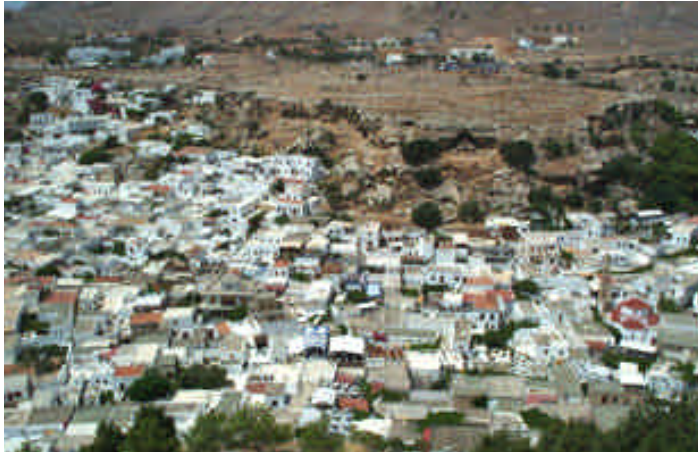
➤ Rodos, Lindos Kasabası

Rodos Kenti kale içinde kalmış eski kentin çevresinde düzenlenmiş modern bir kent. Ada adeta motosiklet cenneti, yollar gayet güzel ve geniş, güneye doğru virajlı orman yolları da bulmanız mümkün. Gülşah da aramıza katılınca motosikletten daha ucuza gelen bir araba kiralyoruz. Günlüğü 38 Euro'ya, 1000cc'lik klimalı