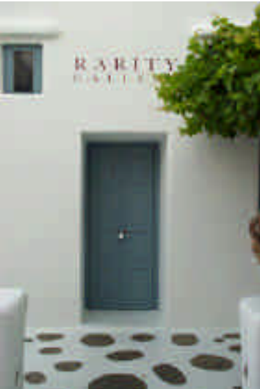
➤ Mikonos'un alçakgönüllü sokakları

deyse hiç rutubet yok, hatta sivrisinek de yok! Kadın, "Pencereleri rahatlıkla açık bırakabilirsiniz burada eşyanıza hiç birşey olmaz" diyor, kendisine bizi plajda yatmaktan kurtardığı için teşekkür etmemizle uyumamız bir oluyor.