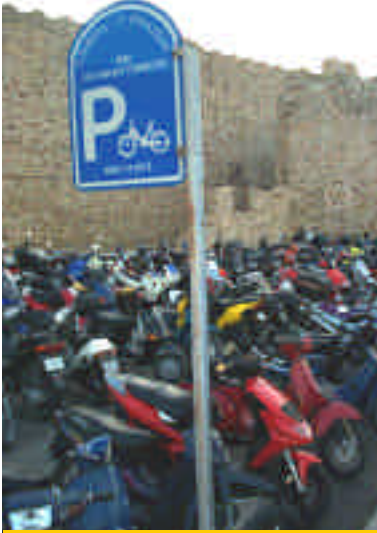
➤ Rodos kale içinde motor dizileri

Uzulttu motor parkı olarak düzenlenmiş alanlar o denli dolu ki, değil motor sokmak, çıkartmak bile bir mesele.