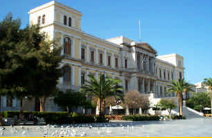
➤ Siros Adası, Ermoupolis Belediye Binası

mız aç ve ara sokaklarda rastladığımız, bir ana-kızın işlettiği küçük ama çok güzel bir lokantada karnımızı doyuruyoruz. Atina'da da yediğimiz gibi burada da enfes bir zeytinyağlı ıspanak yemeği var, battal boy porsiyonun yanında limonla servis ediliyor. Sokaklar bomboş, klasik öğle molası (siesta) görüntüsü. Deniz özlemi duyduğumuz için motor kiralamak istiyoruz. Ne yazık ki günün ortasında kiralık bir araç bulmak mümkün değil, bütün halk adanın batı tarafındaki plajlara gitmiş. Kiralıklı motor aramak için doluşırken yürüdüğümüz mermer kaplamalı sokaklar bizi büyülüyor, yine "iyi ki plaja gitmemişiz" diyoruz. Neo-klasik üsluba sahip taş binalar çok göz alıcı ve ihtişamlı. Ağaçların açtığı pembe çiçekler beyaz mermerlere dökülmüş rüzgârla savruluyor, etrafımızda ikimizden başka kimse yok. Biraz içerilere ilerleyince karşımıza çıkan Miaouli Meydanı'nda Alman mimar Ernst Ziller'in tasarımını yaptığı Neo-klasik üsluptaki büyük Belediye Sarayı (1876) yer almakta. Vardaka Meydanı'nda ise Fransız mimar Chabeau tarafından Milano'daki La Scala'nın bir kopyası olarak tasarlanan Yunanistan'ın ilk opera binası olan Apollon Tiyatrosu'nu görmek mümkün. Hasılı gidilip görülecek, yaşanması gereken bir şehir burası. Belediye Binası'nın önündeki kafede "Kaymaki"li dondurma ile güneşi batırıyoruz bu defa.