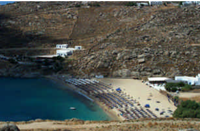
➤ Mikonos, Motor Parkı; Şehire giremeyen araçların park alanı

Uzaktan Santorini'nin hilâl biçimindeki körfezine yaklaşmak rüya gibi geldi bize. O kadar çekici ve değişik bir görüntü var ki önümüzde... Denizden yaklaşık 300 metre yukarıda kurulmuş şehirler küçük beyaz üzüm salkımlarını andırıyor. M.Ö. 3000 yılında Minoslularca kolonileştirilen dairesel biçimli adanın ortasındaki volkanın M.Ö. 1450'de patlaması ile orta kısmı çökmüş, boşluğa dolan deniz yüzünden ada bugünkü hilal biçimini almış. Diğer adı olan Thira, M.Ö. 8. yüzyılda buraya yerleşen Dorlar'dan gelen bir isimdir. Ada-