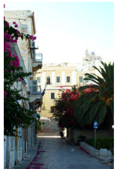
➤ Siros Adası, Ermoupolis Belediye Binası

Tanrı Hermes'ten adını alan Ermoupolis, Siros'un ana limanı ve Kyklad (Orta Ege Adaları Grubu) Adaları'nın en büyük kenti. Ege'nin meşhur meltem rüzgârı biraz sert esiyor olsa da Mikonos'ta inemediğimize seviniyoruz. Büyük tersanesi sayesinde elde ettiği zenginliği ile 19. yüzyılda Yunanistan'ın en önde gelen limanlarından olan şehir, kuzeyde Katolik Ano Siros ve güneyde Ortodoks Vrandado adlı ikiztepelele taçlanmakta, limanın çevresinde yer alan bir amfiteatro biçiminde şekillenmekte. Merkezi olan Plateia Miaouli'nin mimari güzelliği sayesinde Ulusal Tarih mirası olarak kabul edilen kentteki bütün kaldırımların ve yolların tertemiz mermer kaplamaları şehrin bir dönem olağanüstü zenginliğinin işareti. Kıyıda nefis kafeler ve pizzacılar var ancak bizim karnı-